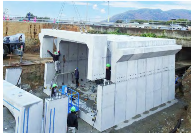
製品名：2分割ボックスカルバート、プレキャスト踏掛版 (本山橋架替本山甲地区外改良工事（香川県三豊市）)

道路、河川、下水、宅地造成などにおける各種土木製品の開発、生態系を含めた環境製品開発、景観、緑化と融合した製品開発はもとより、防災・耐震性を考慮した製品開発へと展開しております。