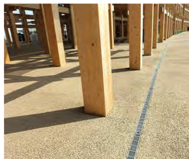
【製品名：かんたん側溝 設置場所：大屋根リング下】