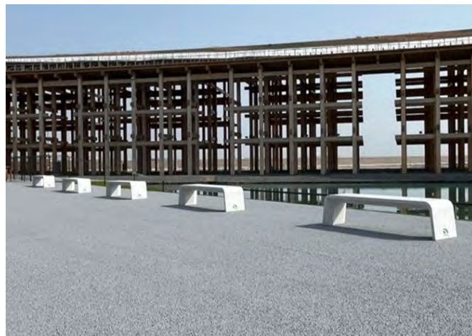
【製品名：ユニティーシェルベンチ、設置場所：ウォータープラザ前】