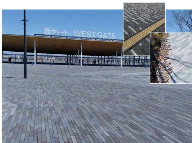
【製品名：SAZARE エコロアクア、設置場所：西ゲート】

去る 4 月 13 日より 10 月 13 日まで 55 年ぶりに開催された「大阪・関西万博」の会場に当社製品が多数採用され、訪れた数多くの人々に、当社製品に触れていただきました。