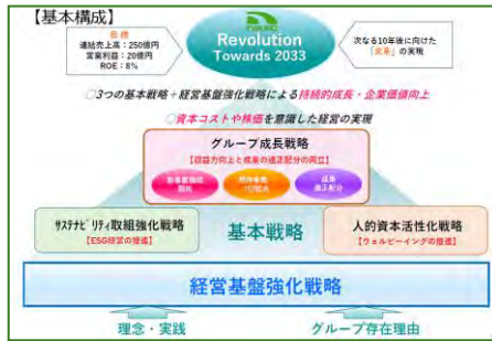
【基本構成・アプローチ】

当社グループの 2025 年度～2033 年度における成長戦略を 3 フェーズに区分して取り組むべく、「日本興業グループ中長期経営計画（Nikko Revolution Towards 2033）」を公表いたしました。「美しく豊かな環境づくりを通じてサステナビリティ実現に貢献する」を基本方針に掲げ、社会課題へのソリューションとグループ全体の変革を目指しながら鋭意取り組んでおります。