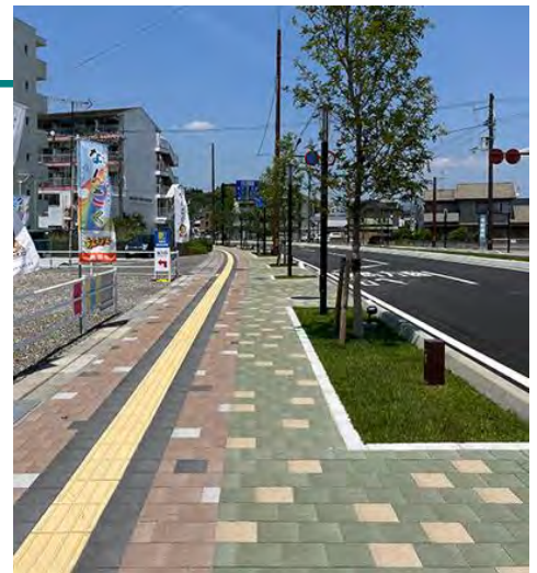
製品名：バリアフリーペイブ (南国シンボルロード（高知県南国市）)

公園、ニュータウン、各種公共施設などに、舗装材を中心とする水平展開から、ファニチュアの垂直展開まで幅広く製品をコーディネートし、提供しております。人と自然にやさしい空間づくりの提案、共感の得られる環境製品の提供と、次世代まで引き継がれる豊かな公共空間の創造に努めております。