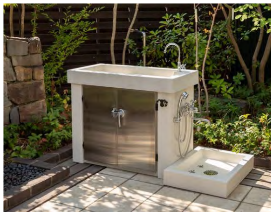
製品名：シャワープレイス「シカクルスタンド」

街並みに調和する外構づくり。 個性を演出するエクステリア。 個人住宅から店舗用製品まで幅広いジャンル で製品を提供し、ガーデニング関連、ペット 関連等新たなテーマを掲げ、快適な空間づくり を追求しております。