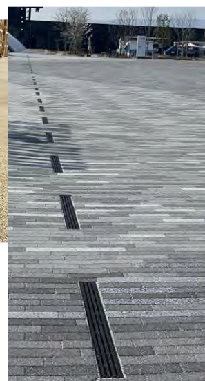
【製品名：ラウンドスcoop側溝 設置場所：西ゲート】

また当社は、納入製品の製造工場（志度工場・長尾工場）メンバーを中心に現場見学会を実施いたしました。