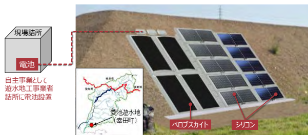
【システム設置イメージ】

当社は、環境省が進める水インフラの空間ポテンシャル活用型再エネ技術実証事業の一環として実施される愛知県の「矢作川・豊川カーボンニュートラルプロジェクト」において、同県幸田町に建設中の菱池遊水地の堤防法面を活用した太陽光実証実験に共同参画しています。