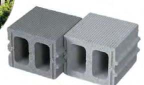
【バリアフリーペイブ SI】