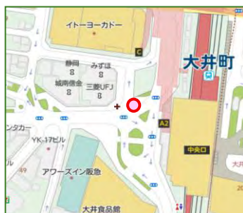
【モデル施設設置場所】

当社は、東京都が推進する、激甚化・頻発化する豪雨災害に備え雨水を「しみこませる」まちづくりを進める「雨水しみこみプロジェクト」に参画、「雨水しみこみアンバサダー」の認定を受け、目下、各種活動を行っております。今般、東京都及び品川区と当社にて、「雨水流出抑制に資するグリーンインフラ施設のモデル整備」に関する3者協定を締結、品川区大井町駅前ロータリーのモデル施設に当社製品「バリアフリーペイブ SI」が施工されました。