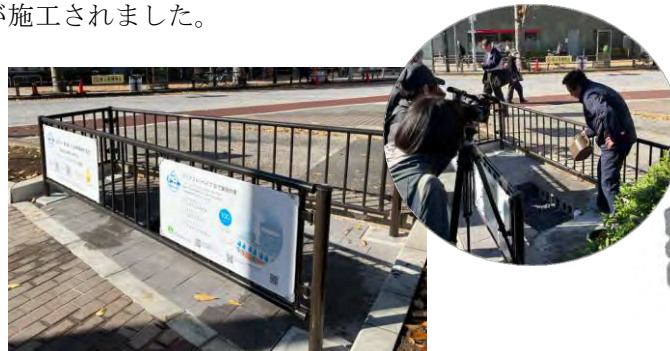
【モデル施設、雨水しみこみ実演（11/26）】